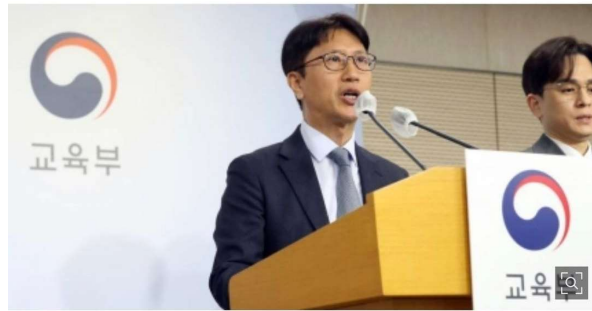
이규민 한국교육과정평가원장이 28일 세종시 정부세종청사에서 2024학년도 대학수학능력시험 시행 기본계획을 발표하고 있다

6월 이후 또 한번의 격변이 있었던, 더욱더 당해의 경향성이 중요하게 여겨지는 올해 평가원의 키워드는 두 가지라고 여겨집니다.